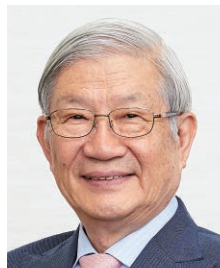
兵庫県立大学 理事長 五百旗頭 真