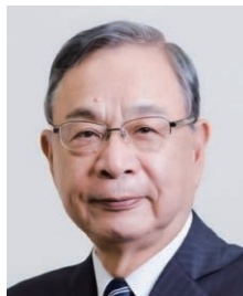
元駐中国特命全権大使 宮本 雄二氏