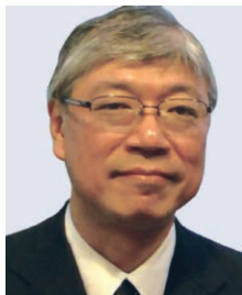
京都大学大学院 法学研究科 教授 中西 寛氏