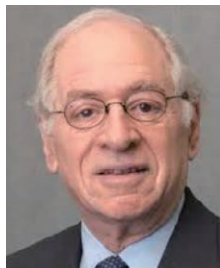
コロンビア大学 政治学部 名誉教授 ジェラルド・カーティス氏