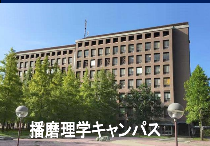
播磨理学キャンパス